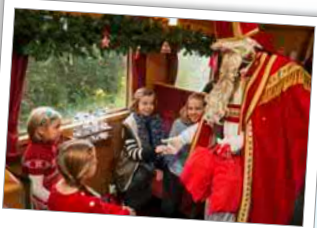
Nikolausfahrten und weihnachtliche Gruppenfahrten